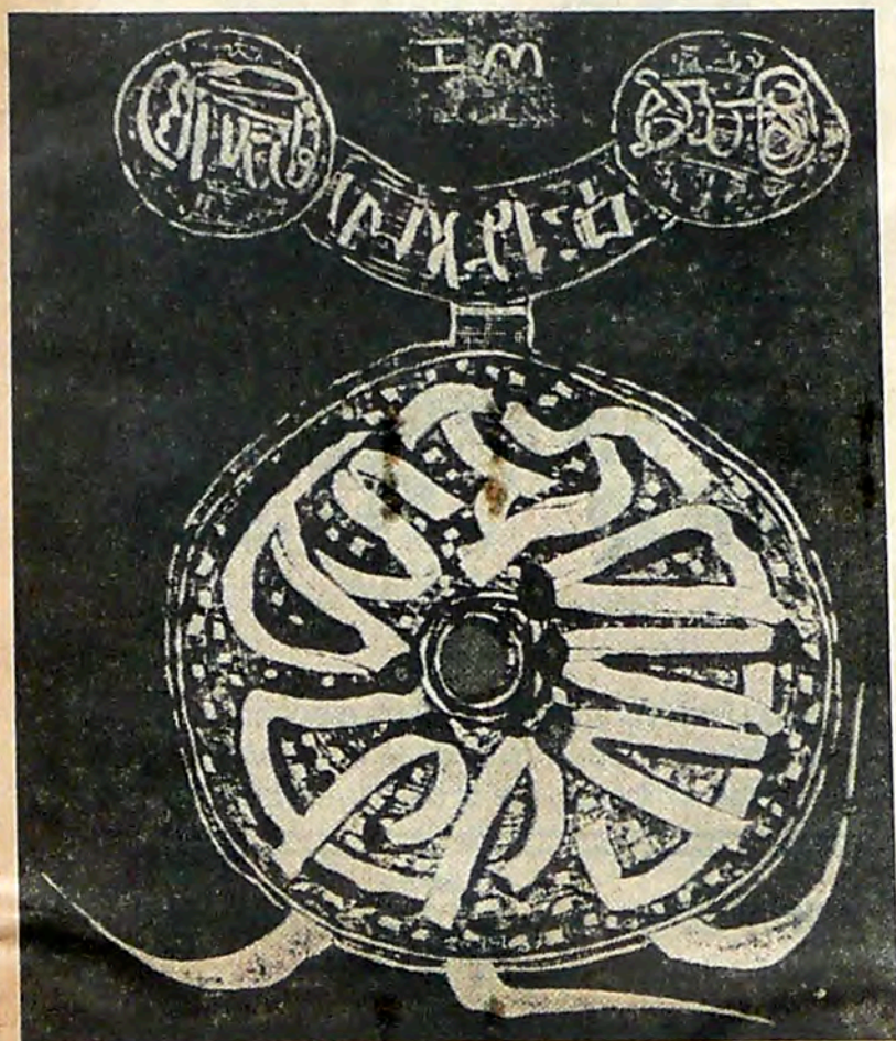
„Perzisch avontuur” van Ed. Heymans