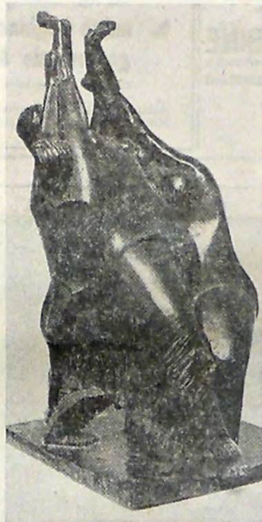
„De Balspelers“ (1927) van O. Zadkine.

genwoordigheid van een ongeveer vijfhonderdkoppig publiek; Heijmans' expositie werd dagelijks bezocht door ongeveer honderd bezoekers.